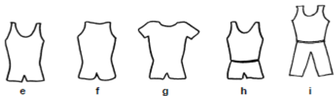
樣例 E 到 I 前後開口處相仿